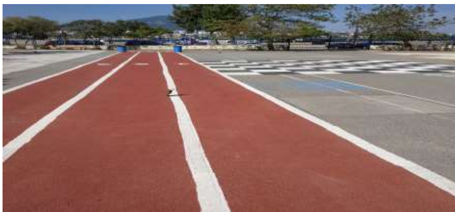
Χώρος συγκέντρωσης σε περίπτωση ανάγκης

Ως χώρος συγκέντρωσης σε περίπτωση ανάγκης, όπως έχει οριστεί από τα αντίστοιχα μνημόνια ενεργειών του σχολείου, είναι το προαύλιο του σχολείου (χώρος που εκτείνεται μπροστά από την αίθουσα εκδηλώσεων) και σε απόσταση τουλάχιστον δέκα (10) μέτρων από την αίθουσα εκδηλώσεων